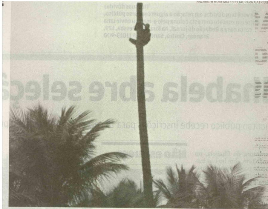
O homem subiu no coqueiro e começou atirar os frutos no calçadão da Praia da Enseada