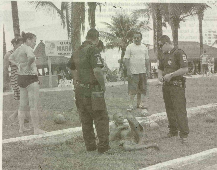
A Guarda Municipal foi acionada, ordenou que o homem descesse do coqueiro e depois ele foi liberado